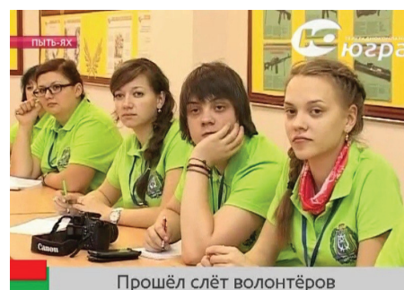
Прошёл слёт волонтеров