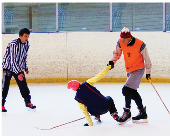
Даже в ранге соперника преподаватели оставались джентльменами